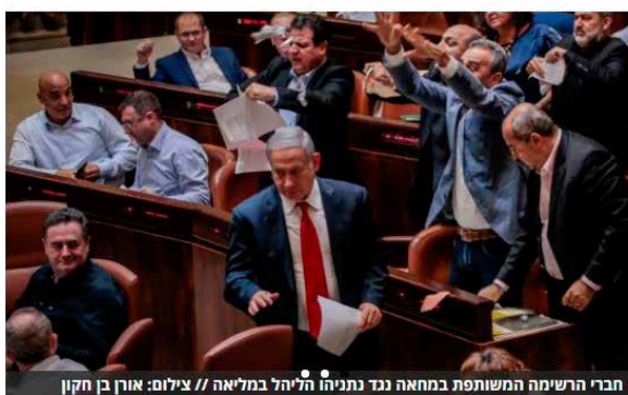
חוק הלאום עבר בכנסת הלילה (בין רביעי לחמישי) בקריאה שנייה ושלישית ברוב של 62 בעד ו-55 נגד. חברי הרישימה המשותפת במחאה נגד נתניהו הלילה במליאה

כתבה בישראל היום עם אישור חוק הלאום בכנסת.